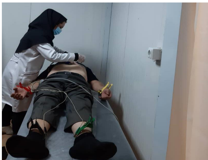
تصویر ج: مرحله ورود دیتا- گرفتن نوار قلب