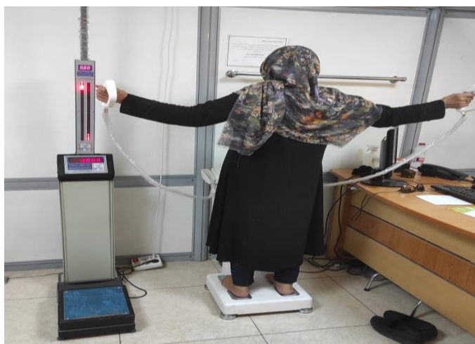
تصویر ب: مرحله ورود دیتا- انجام تن سنجی