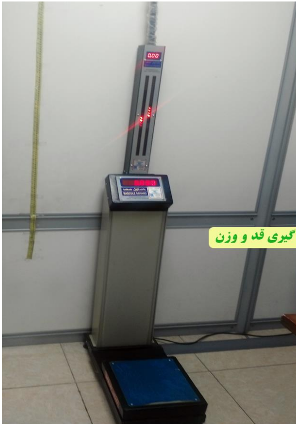
تن سنجی و اندازه گیری قد و وزن