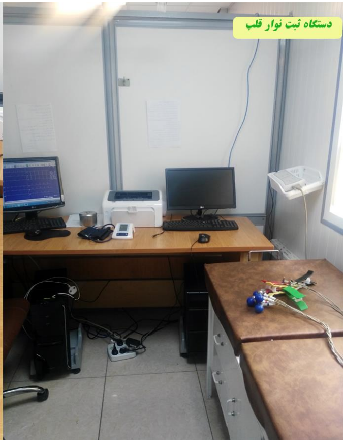
دستگاه ثبت نوار قلب