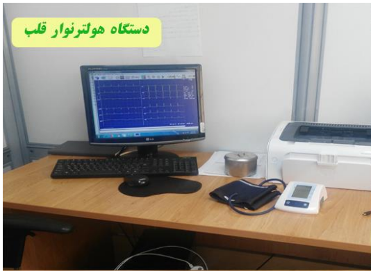
دستگاه هولتر نوار قلب