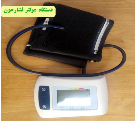
دستگاه هولتر فشار خون